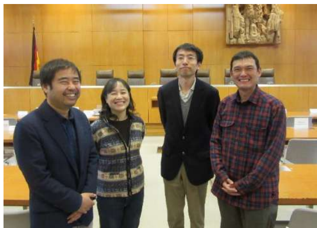
ドイツの憲法裁判所で（2015年11月）