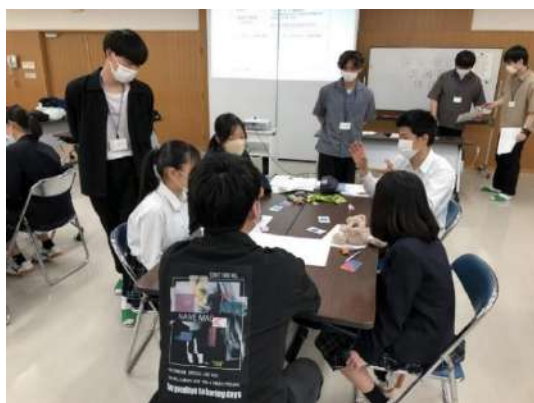
災害現場でどう判断し行動するかの「分かれ道」を高校生とともに考える

武田ゼミは「誰もが安心して暮らせる福祉まちづくりの研究」をテーマに、2008年度より地域の多様な組織等との協働を伴いながら「住民主体の災害時要援護者支援のあり方に関する研究プロジェクト」に取り組んでいます。現4年生8名は、3年次に