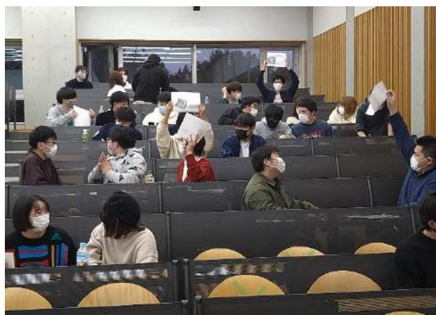
契約交渉とそのための作戦会議をする様子