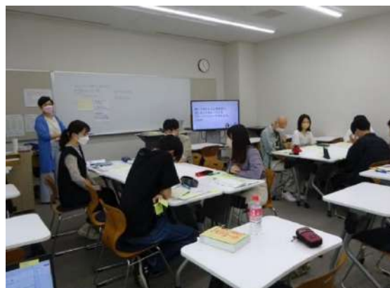
受験勉強の見通しを立てては振り返る、を繰り返すなかで、学生同士が助け合う関係を築く

東北公益文科大学は 2005 年度から社会福祉士の養成を行っています。社会福祉士とは、福祉や介護に関する相談ごとに対応する専門職です。年 1 回実施される国家試験に合格した人が所定の登録を受けることにより、社会福祉士の資格を取得することができます。合格率は新卒・既卒を含めて毎年 30%弱ですが、公益大の現役生 (4 年生) の合格率は平均すると 50%程、令和 3 年度は 60%で、東北圏内の社会福祉士養成をおこなっている私大では 1 位でした。