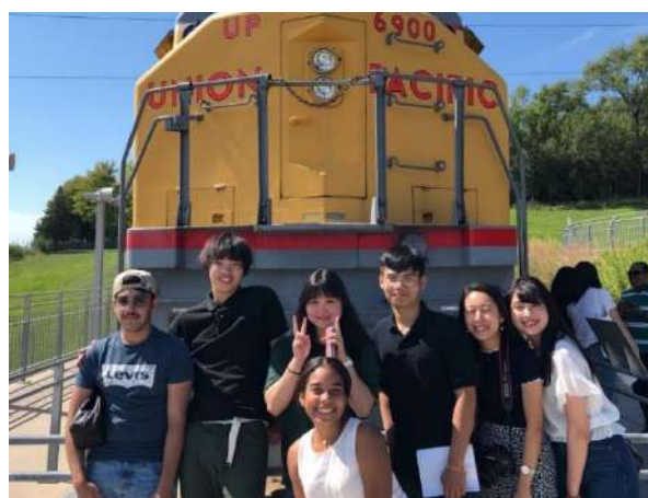
留学先で各国の学生と交流を深めています (2019年、米クレイトン大学への短期留学)

机上の学びではなく、「実際に行ってみて経験して学ぶこと」が実際の留学の醍醐味であり、学びであります。今後とも、本学では世界情勢を慎重に判断しつつ、留学の推進を行っていきたいと考えております。