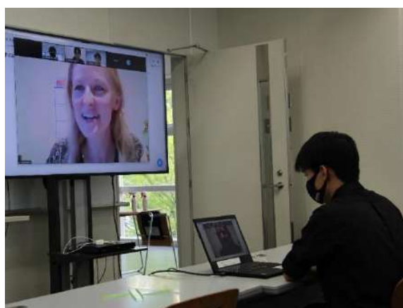
2021年度はオンラインで学んだカナダのリジャイナ大学にも現地留学生を送り出した