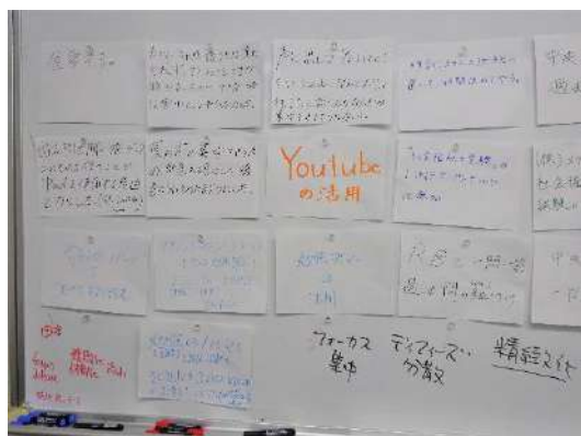
互いの学習法を共有したり (上)、悩みと解決策を出し合ったりする (下) ことで、自分に合った学び方を見い出す

支援するために、卒業生による合格者体験談、年数回の模試とその振り返り、直前対策講座 (科目ごとに教員が内容のポイントを説明したり、過去問題を解説したりする)、勉強の進捗状況についての個別面談など、社会福祉士養成課程ではさまざまな受験対策プログラムを実施しています。しかし、受験勉強に取り組もうとしても、何から手をつければよいのか、どのような勉強方法が自分に合っているのか、ということに悩む学生も少なくありません。