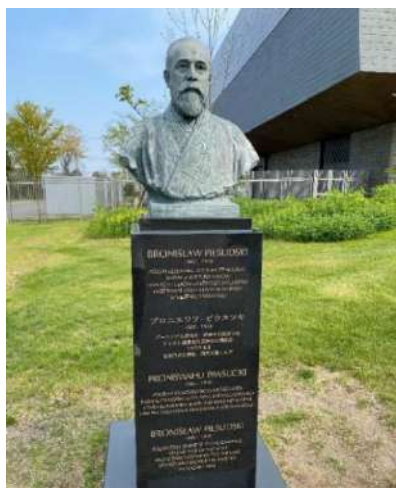
国立アイヌ民族博物館にある ブロニスワフ・ピウスツキの胸像

今後の 100 年以内に、世界の 7000 近くの言語の 9 割以上が絶滅する恐れがあると予測されています。重要な無形文化財である言語及びそれらの言語により表現される知識・価値観・文芸などが失われていく前に後世のために記録保存することが急務です。人間の言葉をコンピューターによって処理する「自然言語処理」という研究分野はその課題への取組みにおいて重要な役割を担うと期待されています。例として、世界中の言語学者が収録してきた音声データの多くは文字起こし作業に必要な負担のため、研究機関のアーカイブ等に長年保管されたまま活用できていないという課題に関して、音声認識技術を用いて解決できる可能性があります。筆者は日本の現地語の一つであり、絶滅危機に瀕しているアイヌ語のための自然言語処理技術の研究に携わっています。