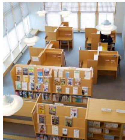
公益大図書館は平日 9:00～20:00、土日祝 9:30～16:30 開館（夏季休暇中は閉館日や時間短縮あり）